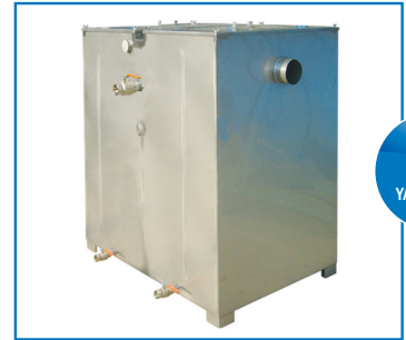
2 L / Sn GRES YAĞ AYIRICI