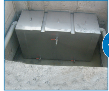
GRES YAĞ AYIRICI MONTAJI